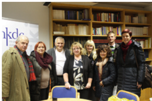
Posjet gradišćanskim Hrvatima

Odjel za kroatistiku i slavistiku organizirao je 21. ožujka 2016. jednodnevni izlet "Goranovo proljeće – Lukovdol". Poznata manifestacija koja veliča poetsko stvaralaštvo i velikoga hrvatskog pjesnika Ivana Gorana Kovačića organizira se svake godine u njegovu rodnom mjestu. Izlet je uključivao vožnju do Lukovdola, šetnju Goranovim rodним mjestom, prisustvova-