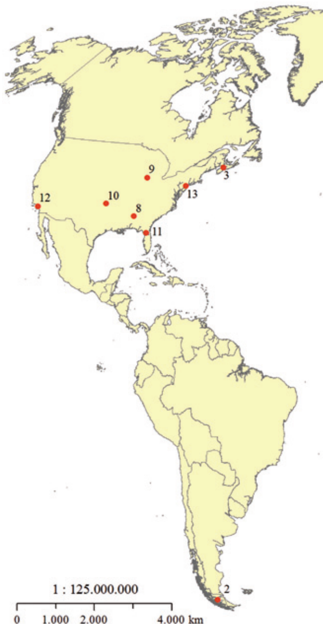
Sveučilišta s kojima je Sveučilište u Zadru potpisalo bilateralnu suradnju

Djelatnice Ureda za međunarodnu suradnju redovito sudjeluju na informativnim sastancima o programima razmjene Erasmus i CEEPUS koje organizira Agencija za mobilnost i programe EU, kao i na organiziranim sastancima za djelatnike ureda za međunarodnu suradnju koji se održavaju na inozemnim visokoškolskim institucijama.