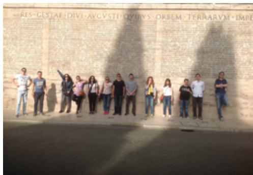
Stručno putovanje studenata Odjela za klasičnu filologiju u Rim