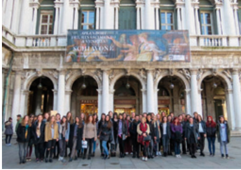
Jednodnevni posjet studenata Odjela za povijest umjetnosti izložbi Splendori del rinascimento a Venezia: Andrea Schiavone tra Parmigianino, Tintoretto e Tiziano

Na izložbi su prikupljena djela iz fonda europskih muzeja, pa je to bila jedinstvena prilika za jasnije konturiranje Schiavoneova likovnog jezika.