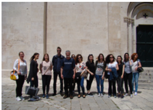
Terenska nastava u Trogiru