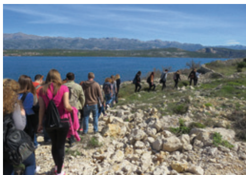
Terenska nastava Odjela za etnologiju i antropologiju u Novigradu