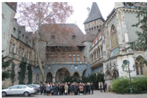
Studijsko putovanje u Budimpeštu

nje dodjeli nagrada, posjet gradiću Severin na Kupu i dvorcu Frankopana.