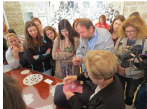
Terenska nastava Odjela za etnologiju i antropologiju na otoku Pagu