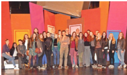
Posjet studenata Hrvatskom narodnom kazalištu u Zadru