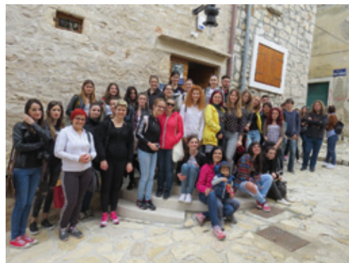
Terenska nastava u Šibeniku i Betini