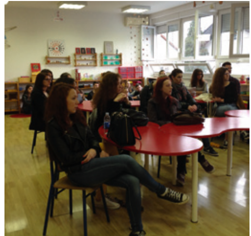
Terenska nastava Odjela za pedagogiju