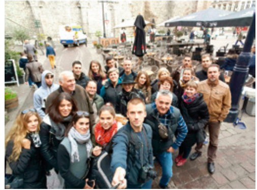
Studijsko putovanje u Belgiju

Od 22. do 26. listopada 2015. u okviru stručnog putovanja studenti i nastavnici Odjela za turizam i komunikacijske znanosti posjetili su Belgiju. U Bruselu su obišli Europski parlament, gdje su se upoznali s radom parlamenta i radom njegovih za-