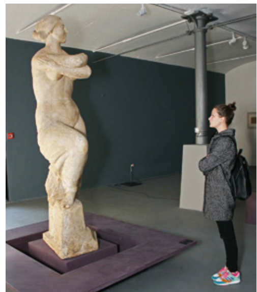
Terenska nastava studenata Odjela za povijest umjetnosti u Zagrebu