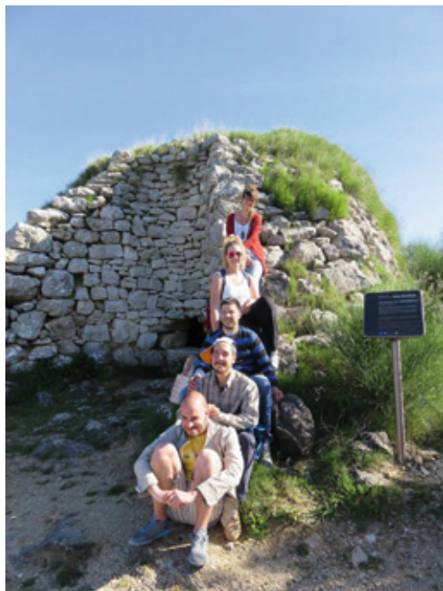
Terenska nastava na Hvaru