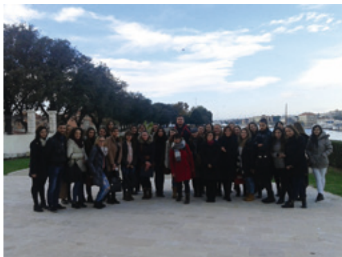
Posjet studenata Odjela za nastavničke studije u Gospiću