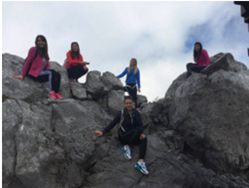
Studenti Odjela za nastavničke studije u Gospiću na stručnom izletu