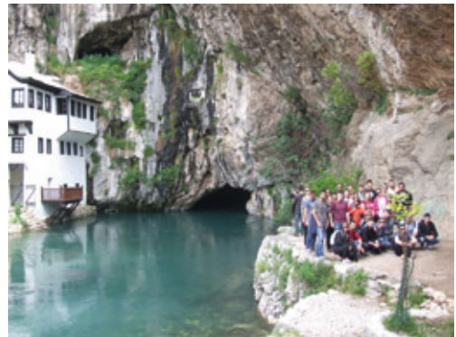
Terenska nastava studenata Odjela za geografiju

podijeljen. Uslijedio je posjet starom kraljevskom gradu Blagaju i vrelu rijeke Bune. Povratak u Zadar bio je oko 20.00 sati.