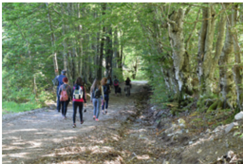
Izlet na Velebit u sklopu kolegija Izvannastavne sportske aktivnosti