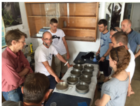
Aktivnosti Centra za interdisciplinarno istraživanje mora i pomorstva