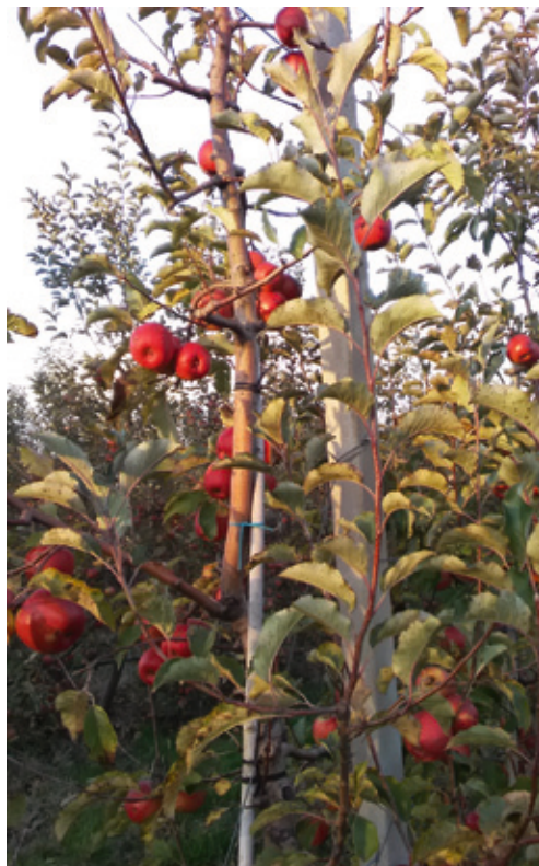
Sveučilišno poljoprivredno dobro "Baštica"