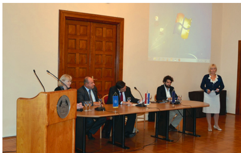
Sudionici Radne skupine Europske komisije na temu "Školske politike – upravljanje inicijalnim obrazovanjem nastavnika"

Sudionike Radne skupine svečano je pozdravio ministar obrazovanja, znanosti i sporta prof. dr. sc. Vedran Mornar koji je istaknuo važnost obrazovanja kao temelj budućnosti svakog čovjeka te kao ključnu odrednicu svakoga čovjeka i svakoga obrazovnog sustava.