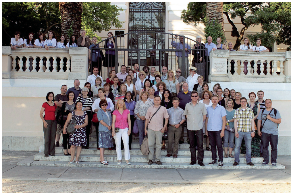
Sudionici konferencije LIDA 2014.