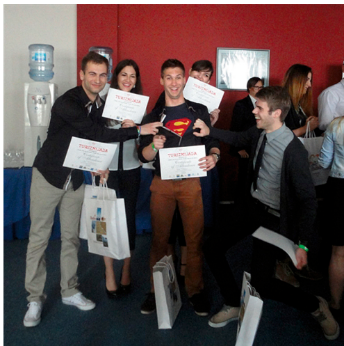
Osvajanje nagrade studenata Odjela za turizam i komunikacijske znanosti na "Turizmijadi 2014"

Studenti Odjela za turizam i komunikacijske znanosti osvojili su prvo i treće mjesto u natjecanju na Turizmijadi 2014. u izradi studije slučaja: "Novi sportski sadržaji u nacionalnim parkovima kao dio turističkog proizvoda" u okviru Međunarodnog kongresa studenata Fakulteta za turizam i hotelijerstvo u Budvi od 30. travnja do 4. svibnja 2014.