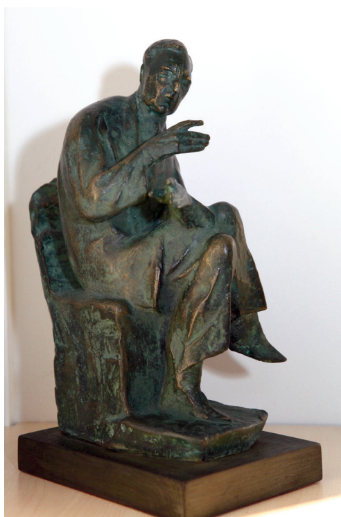
Statua dr. Aloisa Mocka