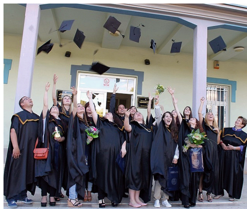
Promocija prvostupnika knjižničarstva

Uz prigodni program 30. lipnja 2014. u Svečanoj dvorani na Novom Kampusu Sveučilišta u Zadru održana je promocija prvostupnika knjižničarstva.