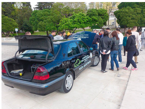
Predstavljanje električnog automobila Strukovne škole "Vice Vlatković"