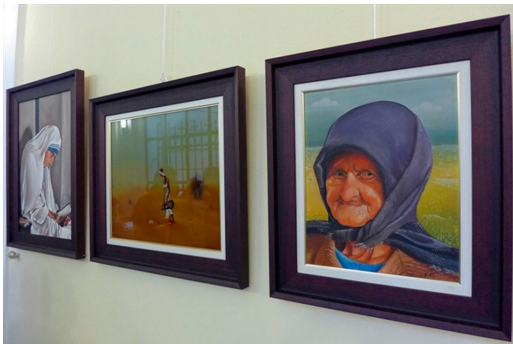
Slike s izložbe Vladimira Bedekovića