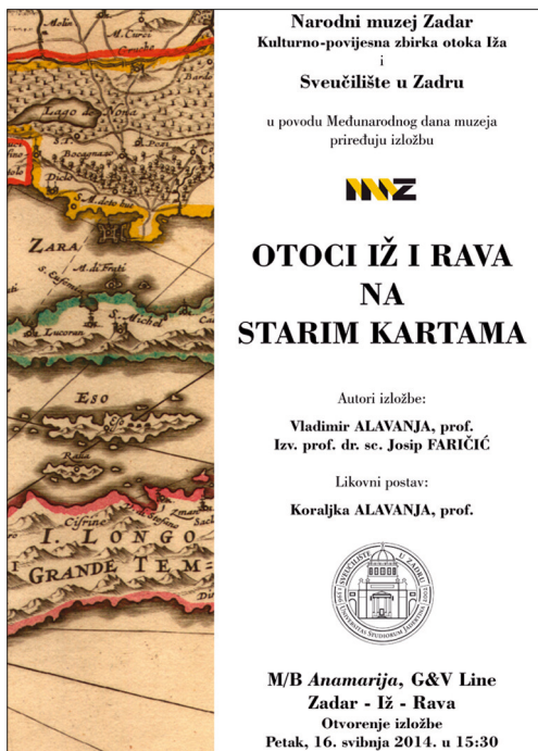
Plakat izložbe "Otoci Iž i Rava na starim kartama"

su reprodukcije nastale digitaliziranjem cijelih karata ili njihovih isječaka s prikazima Iža i Rave, a koji se čuvaju u arhivima i knjižnicama u Zadru, Zagrebu, Splitu, Veneciji, Beču, Parizu pa i u pojedinim američkim zbirka. Među više desetaka karata na kojima su prikazani otoci Iž i Rava odabrano je trideset karata koje možda najbolje oslikavaju razvoj kartografije i predstavljaju reprezentativna postignuća starih europskih i hrvatskih kartografa.