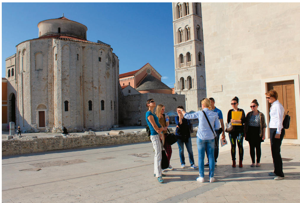
Prvi Zadarski lingvistički forum