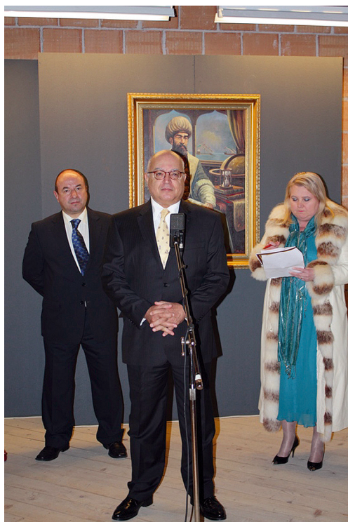
Otvorenje izložbe "Piri Reis – kartograf sultana Sulejmana Veličanstvenog"