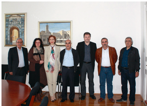
Posjet predstavnika Sveučilišta Firat (Turska)