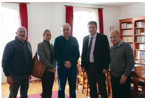
Posjet predstavnika Turske zaklade za podvodnu arheologiju