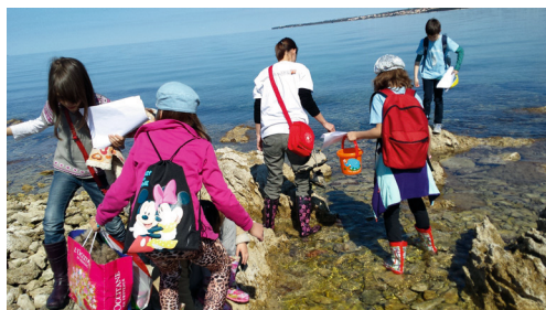
Radionica "Valovi u boci"

Radionica "Valovi u boci" za djecu srednje i starije skupine Dječjeg vrtića "Kocka