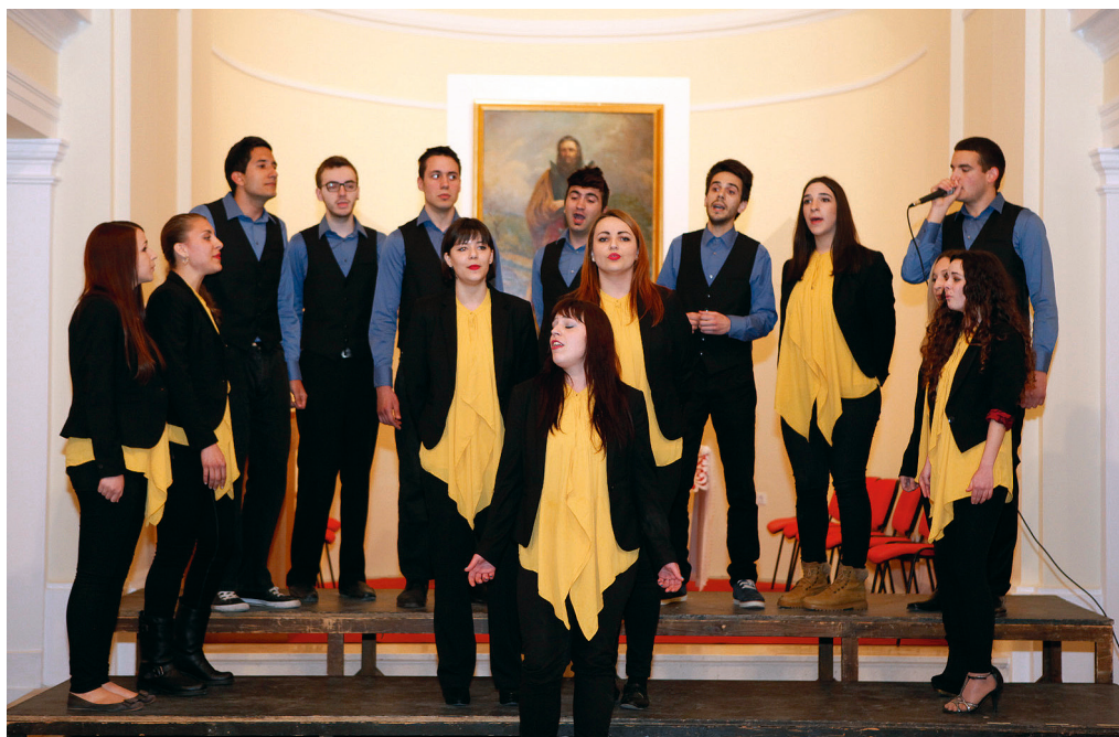
Nastup vokalnog sastava AKA Crescendo na koncertu "Sveučilište Zadru gradu"