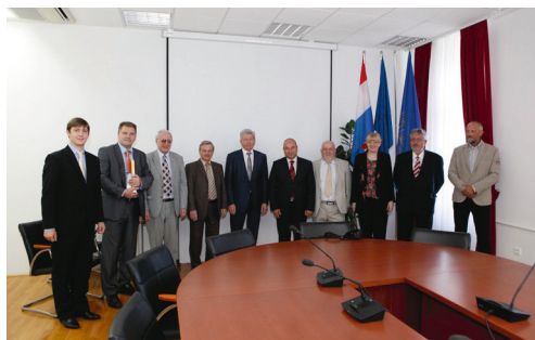
Posjet delegacije Tehničkog sveučilišta iz Rige (Latvija)

Delegacija Tehničkog Sveučilišta u Rigi (Latvija), u sastavu rektora prof. Leonīdisa Ribickisa i njegova savjetnika za razvoj i suradnju gospodina Artura Zepsa, posjetila je naše Sveučilište 22. listopada 2013. Uprava Sveučilišta u Zadru i pročelnik Pomorskog odjela predstavili su rektoru Ribickisu i njegovu savjetniku organizaciju i rad Sveučilišta. Razmatrala su se moguća područja suradnje. Rektor Ribickis bio je na Sveučilištu u Zadru do 25. listopada kao sudionik DAAAM konferencije.