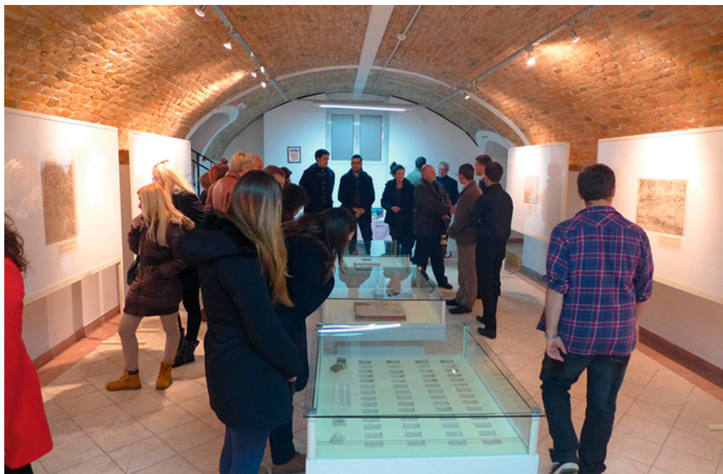
Izložbe u sklopu 9. savjetovanja Kartografija i geoinformacija

- 21. studenoga do 29. studenoga 2013., Državni arhiv u Zadru.