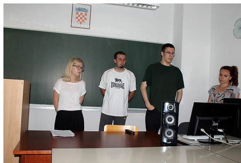
Dani studenata knjižničarstva infoDASKA 2014.

Studentska konferencija Dani studenata knjižničarstva infoDASKA 2014. održana je 23. i 24. svibnja 2014., a domaćini su bili studenti Odjela za informacijske znanosti Sveučilišta u Zadru. Tema konferencije bila je "Uloga informacijskih ustanova u lokalnoj zajednici". Odsjek za informacijske znanosti Filozofskog fakulteta u Osijeku svojim su izlaganjima predstavljale dvije studentice, istoimeni odsjek s Filozofskog fakulteta u Zagrebu dvanaest studenata te s Edukacijsko-rehabilitacijskog fakulteta još jedna studentica. S Odjela za informacijske znanosti Sveučilišta u Zadru u izlaganjima je sudjelovalo sedam studenata i tri profesora. Jedno je predavanje održalo dvoje djelatnika Znanstvene knjižnice Zadar. Konferenciju su zajednički financirali Odjel za informacijske znanosti i Studentski Zbor Sveučilišta u Zadru, a sljedeće godine istoimenoj konferenciji domaćini su studenti iz Osijeka.