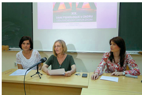
XIX. Dani psihologije u Zadru