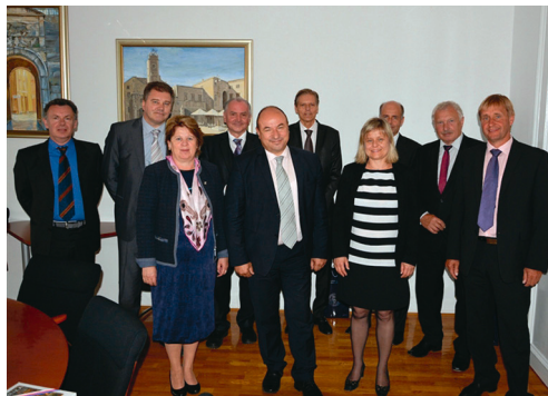
Posjet senatora Stalne komisije za razvoj sela Češke Republike