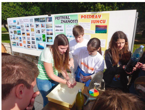
Festival znanosti na rivi