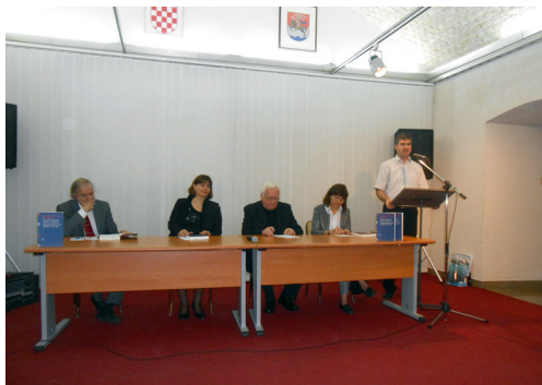
Predstavljanje knjige "Giornali umoristico-satirici in italiano e veneto-zaratino a Zara nell'800 e nel '900"

KONCERT U POVODU ZAVRŠETKA NASTAVE U AKADEMSKOJ GODINI 2013./2014.