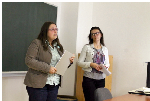
Smotra završnih radova prvostupnika knjižničarstva