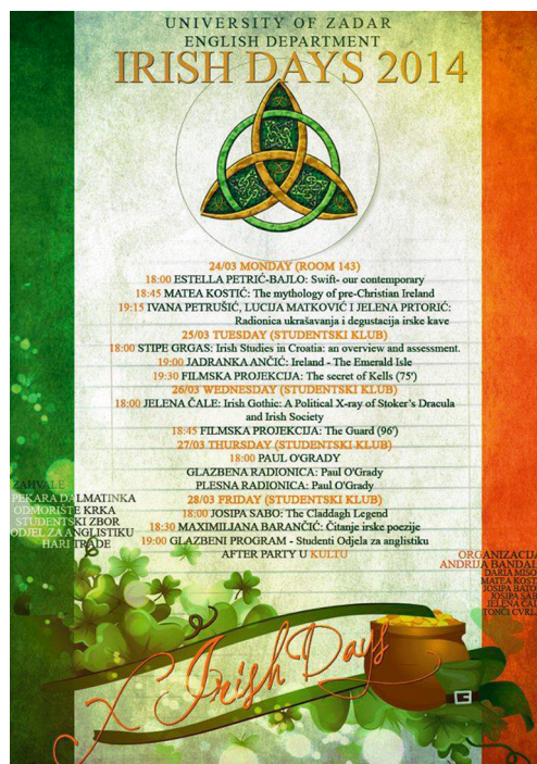
Plakat "X. Irski dani"

Najdugovječniji studentski projekt na Sveučilištu u Zadru akademske godine 2013./2014. proslavio je desetu godišnjicu. "Irski dani", u organizaciji studenata i studentica Odjela za anglistiku u suradnji sa Studentskim zborom Sveučilišta u Zadru, prvi put su se održali 2004. godine. Organizirali su ga tadašnji studenti i studentice anglistike, a nove generacije su prigrllile projekt te nastavile tradiciju i nakon što su začetnici ideje diplomirali. Cilj projekta je promocija i upoznavanje studenata s bogatom irskom kulturom. Projekt je nastao inicijativom studenata Odjela za anglistiku s ciljem da se ostalim studentima približe