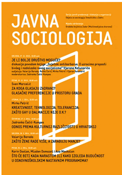
Plakat "Javna sociologija"