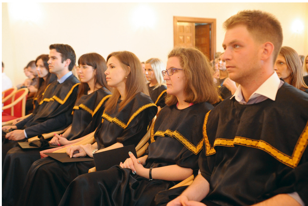
Svečana promocija prvostupnika Odjela za ekonomiju

U ponedjeljak, 16. lipnja 2014. u 19 sati, u Multimedijalnoj dvorani Novog kampusa, održana je VI. promocija prvostupnika kulture i turizma. Na svečanosti je