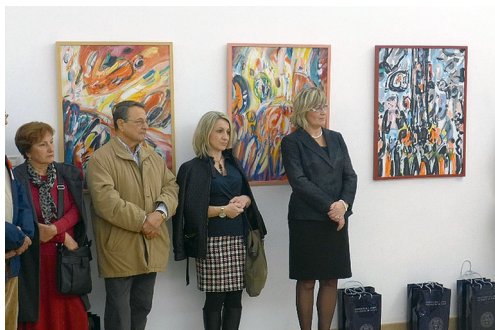
Izložba akademskih slikara sa Sveučilišta u Zadru