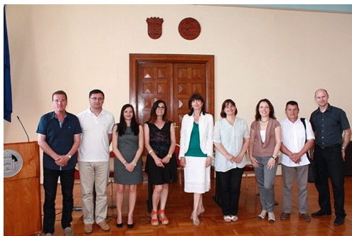
Članovi Alumni kluba Sveučilišta u Zadru

ne, stručne i praktične aktivnosti članova poniklih na zadarskom sveučilištu. Na sjednici je prihvaćen prijedlog Statuta kluba te je zaključeno kako će se nastaviti s radom kluba te nastojati ostvariti suradnju sa sličnim udrugama u Hrvatskoj i inozemstvu.