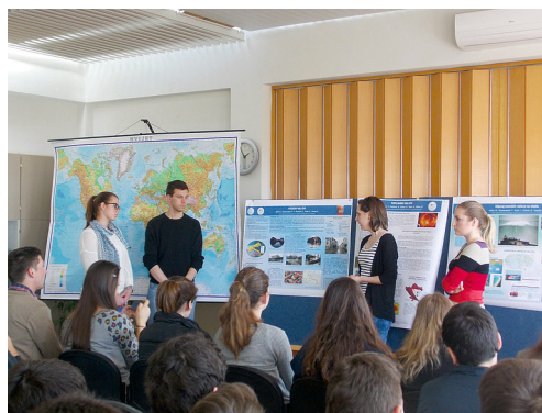
Predavanje "Valovi u prirodnim procesima"

Od 5. do 12. travnja 2014. u petnaest hrvatskih gradova održao se 12. Festival znanosti. Tema festivala bili su valovi. Sveučilište u Zadru se zajedno sa svojim partnerima uključilo u organizaciju ove