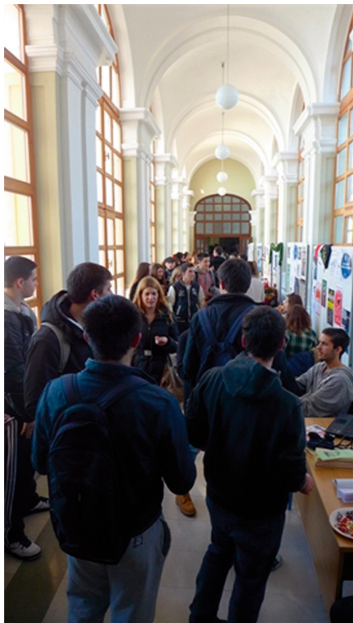
Otvoreni dan Sveučilišta u Zadru

jezika. Otvoreni dan završen je koncertom studentske klape A.K.A Crescendo u studentskom klubu Božo Lerotić.