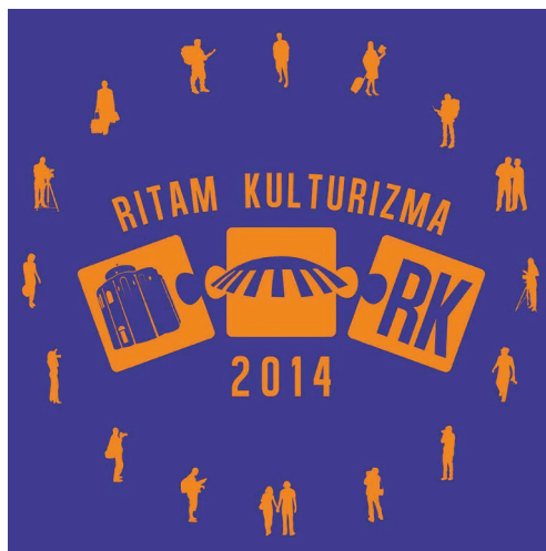
Ritam kulturizma 2014.

U Arheološkom muzeju prikazan je kratki studentski film "Ritam nastanka" o projektu koji ove godine slavi peti rođendan. Uspjeh ovogodišnjeg Ritma Kulturizma posebice se očitovao prilikom održavanja sajma autohtonih proizvoda na Forumu, na obostrano oduševljenje brojnih izlagača i posjetitelja. Održano je predavanje i radionica o zadarskoj kulturnoj baštini i društvena igra na istu temu. Na okruglom stolu, na temu zapošljavanja mladih u turizmu, sudjelovali su stručnjaci i značajni poslodavci na području turizma. Održana je i job coaching radionica, prezentacije uspješnih poduzetničkih pothvata mladih – primjeri društvenih igara koje promoviraju Hrvatsku kao atraktivnu turističku destinaciju, predavanja na teme "Couchsurfing" i "Glazbeni festivali u funkciji razvoja turizma" te predstavljanje ideja na temu: "Vizija moga grada" na kojem su sudjelovali studenti s različitih hrvatskih sveučilišta. Gostujući predavači iz tvrtki Philip Morris i SELECTIO kadrovi d.o.o. održali su predavanje i radionicu