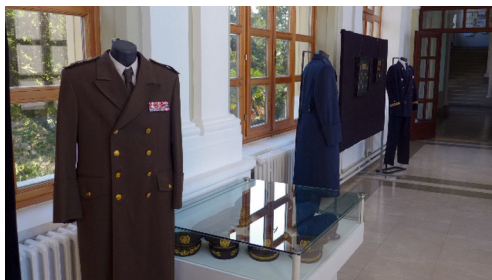
Izložba hrvatskoga ratnog znakovlja, odora i odlikovanja Republike Hrvatske

Sveučilište u Zadru i Hrvatsko grboslovno i zastavoslovno društvo priredili su znanstveno-stručni skup "Semiologija obrambenoga Domovinskog rata" koji je održan 5. prosinca 2013. u Svečanoj dvorani Sveučilišta u Zadru. Generalni pokrovitelj bio je Studentski zbor Sveučilišta u Zadru. Na skupu je održano trinaest izlaganja i četiri rasprave te je priređena i prigodna izložba hrvatskoga ratnog znakovlja, odora i odlikovanja Republike Hrvatske.