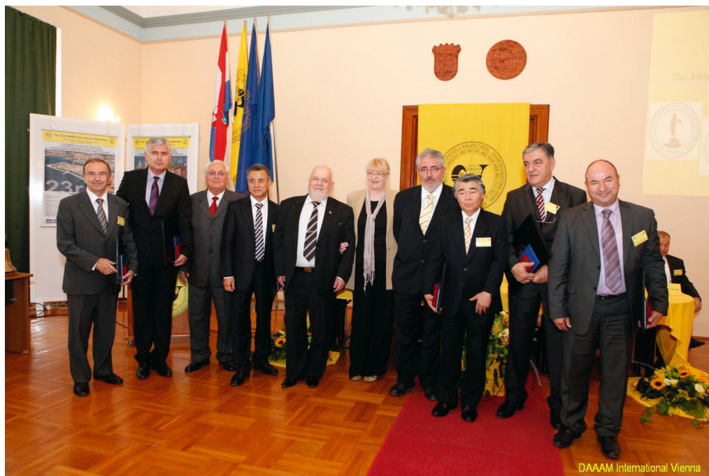
24. DAAAM International znanstveni simpozij