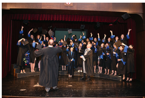
Svečana promocija studenata Odjela za nastavničke studije u Gospiću