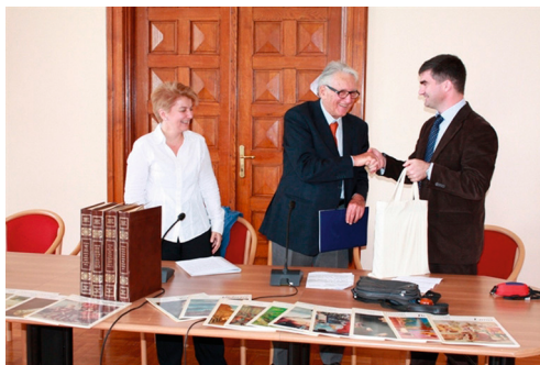
Donacija monografija iz serije I maestri del colore Odjelu za povijest umjetnosti

Odjel za povijest umjetnosti Sveučilišta u Zadru primio je sto devedeset monografskih obrada slikara iz glasovite serije I Maestri del Colore izdavačke kuće Fratelli Fabbri Editori. Donacija se sastoji od izdanja koja monografski obrađuju velike protagoniste povijesti europskoga slikarstva u izvrsnim reprodukcijama popraćenim tek-