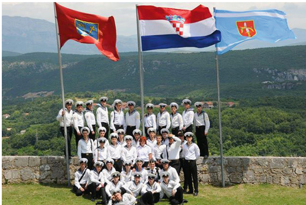
Posada ruskog školskog jedrenjaka "Nadežda"

109 metara, namijenjen je izobrazbi budućega pomorskog časničkog kadra, a nalazi se u vlasništvu Pomorskog sveučilišta G. I. Nevelsky iz Vladivostoka. Brod je izgrađen u Poljskoj, u brodogradilištu Gdanjsk 1991., a završen je podizanjem ruske zastave 5. lipnja 1992. Prototip je jedrenjaka s početku XX. stoljeća, s ukupno dvadeset šest jedara. Motorni pogon koristi se uglavnom samo za navigaciju prilikom manevriranja pri ulasku i izlasku iz luka ili u olujnim uvjetima. Ovo je prvi put da je brod u Jadranskom moru, a luka Zadar izabrana je upravo zbog postojanja studija ruskoga jezika i književnosti na našem Sveučilištu. Osim što su studenti i ostali građani mogli razgledati Nadeždu od 18. do 20. lipnja 2014., Odsjek za ruski jezik i književnost organizirao je za kadete izlet "Šibenik i Knin – hrvatski kraljevski gradovi" na kojem se pružila mogućnost da se mladi kadeti bolje upoznaju s povijesti šire zadarske okolice.