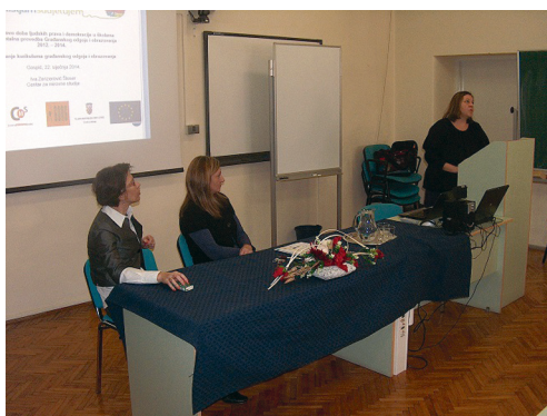
Javna tribina "Predstavljanje kurikuluma i procesa uvođenja građanskog odgoja i obrazovanja"

"Predstavljanje kurikuluma i procesa uvođenja Građanskog odgoja i obrazovanja" – javna tribina na Odjelu za nastavničke studije u Gospiću Sveučilišta u Zadru održana je 22. siječnja 2014. Organizirana je u suradnji s Mrežom mladih Hrvatske, Centrom za mirovne studije i GONG-om. Na tribini je predstavljen kurikulum "Građanskog odgoja i obrazovanja", "Dobri primjeri prakse elemenata Građanskog odgoja i obrazovanja na visokoškolskoj razini" te je izložen "Pregled i potrebe učiteljskih studijskih programa za Građanski odgoj i obrazovanje".