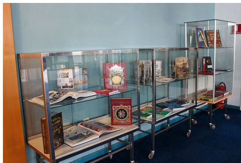
Izložba knjiga Fonda Aleksandra Solženicyna u Gradskoj knjižnici