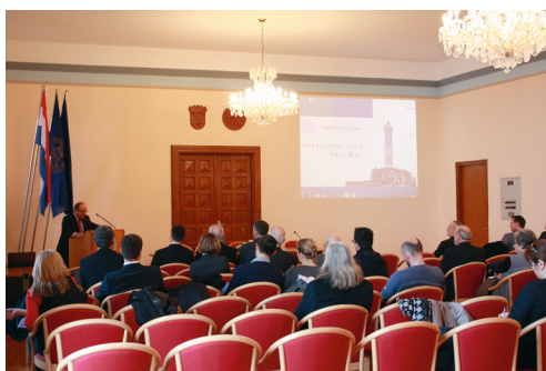
Znanstveni skup Veli Rat

U Svečanoj dvorani Sveučilišta u Zadru 5. i 6. prosinca 2013. održan je znanstveni skup Veli Rat. Trideset osam autora izložilo je trideset četiri rada u kojima je obrađeno prirodoslovlje, arheologija, povijest, stanovništvo, gospodarstvo i kulturna baština Velog Rata.