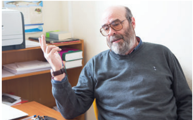
Talijanistika je jedan od odsjeka (danas odjela) koji su u temelju nekadašnjega Filozofskoga fakulteta (danas Sveučilišta) u Zadru

Odjel za talijanistiku Sveučilišta u Zadru osnovao je Odsjek za talijanski jezik Sveučilišta u Mostaru na kojemu predaju mnogi profesori sa zadarske talijanistike dok se, kako kaže prof. Tomas, u glavnome gradu Hercegovine