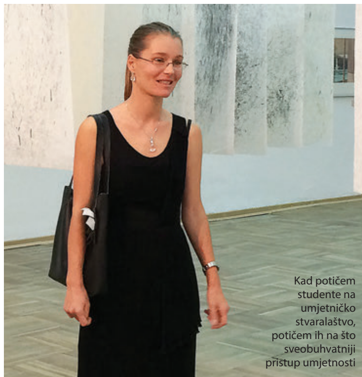
Kad potičem studente na umjetničko stvaralaštvo, potičem ih na što sveobuhvatniji pristup umjetnosti

kim radom bavim posljednjih petnaestak godina, najprije kao profesionalna umjetnica, odnosno članica Zajednice samostalnih umjetnika Hrvatske, a zatim kao sveučilišna profesorica. Nekoliko godina radila sam u svojstvu asistenta vanjskoga suradnika na Akademiji primijenjenih umjetnosti Sveučilišta u Rijeci, a od 2010. godine zaposlena sam na Učiteljskome fakultetu u Rijeci, Odjelu u Gospiću, koji zatim postaje Odjel za nastavničke stu-