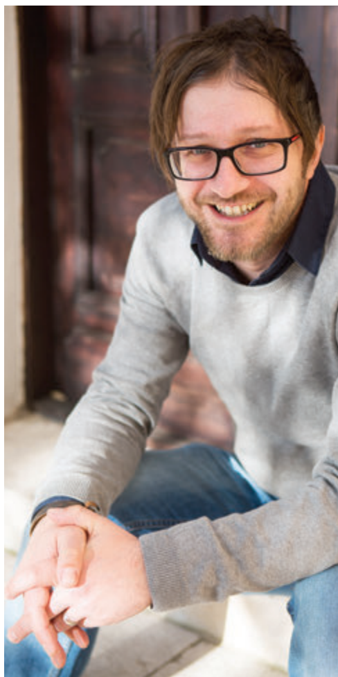
Prijevod hrvatskih pisaca na engleski jezik događaju se sporadično, 'bez jasnog plana i reda'

Kuzmanović je itekako svjestan teškoća kad je riječ o uspjehu književnika malih naroda na velikome književnom tržištu SAD-a i Europe. Napominje kako je temeljni problem činjenica da u Hrvatskoj zapravo ne