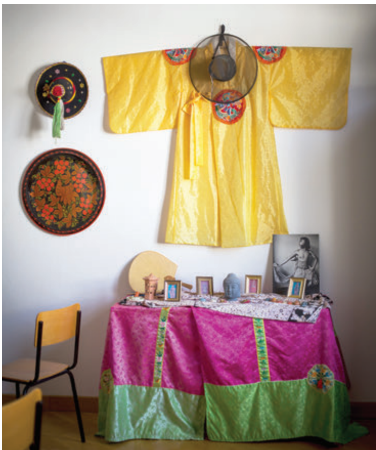
Neki od stranih studenata koji nam pristižu putem razmjene pišu svoje diplomske radove na teme vezane za Hrvatsku i Zadar

„Svaki je otok po definiciji relativno zatvorena sredina. Ljudi koji su tamo živjeli svakoj čestici zemlje dali su ime jer je zemlja dragocjena, svaki komadić zemlje, svaka lokva, svako vrelo, svaka čestica ima svoje ime, a ta imena često nigdje nisu zapisana. Ako se to ne popiše, odlazi u zaborav. U leksičkom smislu, to su ponekad najstarije zabilježbe nekih hrvatskih riječi, i ne samo hrvatskih, nego je nerijetko riječ o leksičkim ostacima romanizama i utjecajima drugih naroda koji su živjeli na tom prostoru. Imena otoka i većih naselja većinom potječu iz predrimskog doba, ali ima i mnogo imena iz grčkog i rimskog doba, no to su uglavnom toponimi za veća naselja i važnije zemljopisne objekte. Takozvana mikrotoponimija, odnosno imena manjih čestica, šuma, livada, oranica i pašnjaka u velikoj je većini hrvatska i slavenska, samo u obalnome pojasu ponekad romanska, talijan-