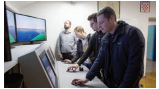
Na simulatoru studenti stječu vještine manevriranja brodom