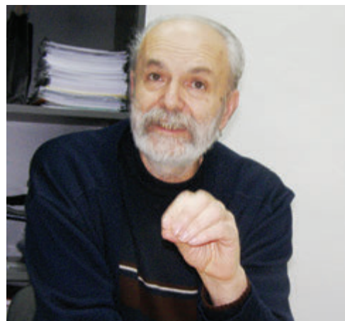
Na preddiplomskome studiju kulture i turizma pratimo sva tjedna kulturna zbivanja u Zadru

Odjel za turizam i komunikacijske znanosti vuče korijene iz 70-ih godina prošloga stoljeća kada je Pedagoška akademija u Zadru (u sastavu tadašnjega Filozofskog fakulteta) pokrenula turistički studij, dvogodišnji - Turistička kultura i Selektivni turizam. Godine 1994. pokrenut je četverogodišnji diplomski studij Kultura i turizam na Odsjeku Filozofskoga fakulteta. Osnivanjem Sveučilišta u Zadru 2002., Odsjek za kulturu i turizam postao je Odjel za informatologiju i komunikologiju, koji je 2009. promijenio naziv u Odjel za turizam i komunikacijske znanosti. Na njemu se izvodi preddiplomski studij Kultura i turizam. Nakon preddiplomskoga studija student može birati studije Kulturna i prirodna baština u turizmu, Novinarstvo i odnosi s javnostima te Poduzetništvo u kulturi i turizmu.