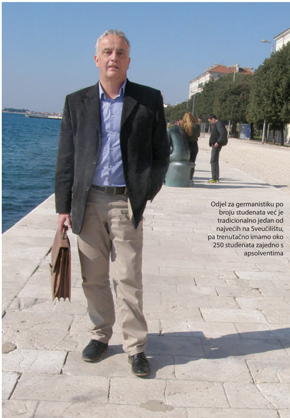
Odjel za germanistiku po broju studenata već je tradicionalno jedan od najvećih na Sveučilištu, pa trenutačno imamo oko 250 studenata zajedno s apsolventima

Reforma je kod nas počela od glave, tj. od visokoškolskoga obrazovanja, pa je uvođenje državne mature kao jedinog kriterija upisa na studije, uz nereformirane srednje škole i gimnazije, u koje se opet upisuju učenici iz također nereformiranih osnovnih škola i često s nerealnim prosjekom ocjena, dovelo do toga da mnogi maturanti upisuju određeni studij bez dostatnoga predznanja i prave motivacije